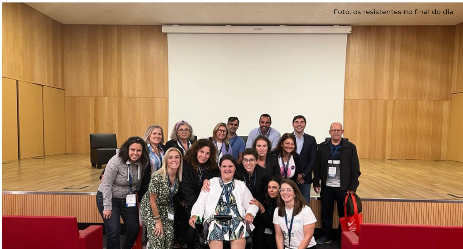
Foto: os resistentes no final do dia